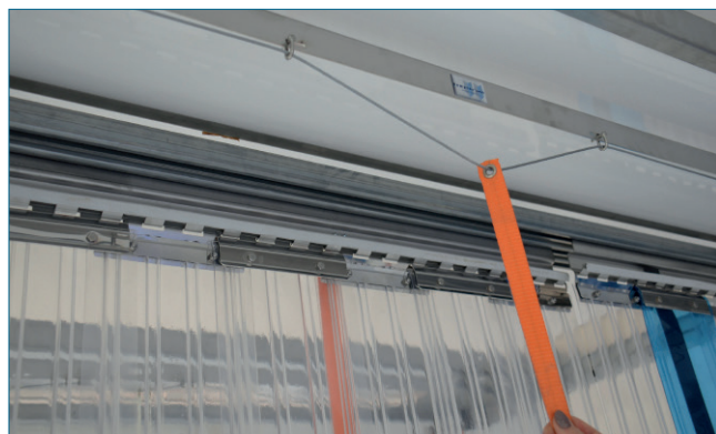
Abb. 4: Einhand-Bedienung

Die Längsverfahr-Einrichtung folgt für alle temptec Systeme dem gleichen Funktionsprinzip.