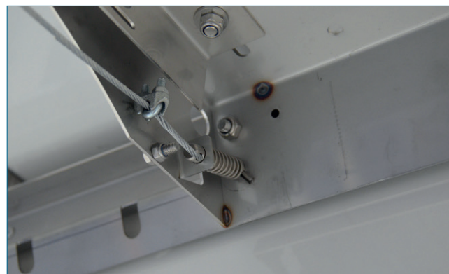
Abb. 5: Längsverfahr-Einrichtung, Detail

Die einzigartigen, geneigten Laufflächen der Führungsschienen gewährleisten Leichtgängigkeit und einfache Reinigung/Desinfektion.