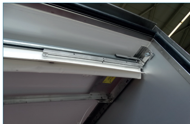
Abb. 3: Längsverfahr-Einrichtung

Das freitragende System bietet Platz für eine Luftleitplane oder andere feste Einbauten im Dachbereich. Zudem hat es den Vorteil, dass das Kofferdach komplett frei bleibt von Befestigungen (z. B. Führungsschienen) und damit leicht zu reinigen / zu desinfizieren ist.